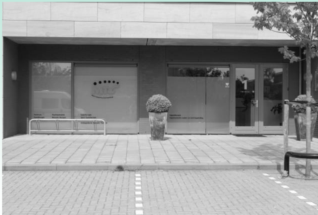
MTC Hoftuin, Hugo de Grootsingel 1

U kunt via 0355241389 tussen 8.45 en 12.00 telefonisch een afspraak maken of via de website www.mtchuizen.com .