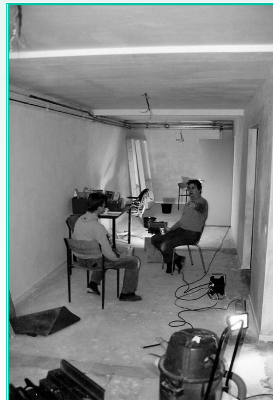
Verbouwing '98-Pauze in de aanbouw