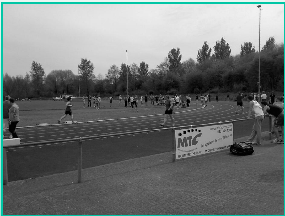
Atletiek Vereniging Zuidwal

behandelen van sportspecifieke aandoeningen en helpt de sporter weer terug te komen op zijn maximale sportspecifieke belastbaarheidsniveau. Binnen het MTC zijn meerdere sportfysiotherapeuten werkzaam. Gezien hun relaties met de verschillende sportverenigingen zijn de contacten betreffende sponsoring tot stand gekomen. De eerste vereniging, die een nauwere samenwerking met het MTC aanging was de Volleybal Vereniging Huizen. Deze vereniging wilde veel meer activiteiten voor haar jeugd organiseren en hadden daar geld voor nodig. Zo ook andere verenigingen. Vervolgens volgde de Atletiek Vereniging Zuidwal, de Voetbal Vereniging Zuidvogels en vanaf 1 mei zal ons logo ook te zien zijn langs het veld van de Korfbal Vereniging Huizen en op de skibaan de Wolfskamer. Wij weten dat onze bijdrage aan de verenigingen goed besteed wordt en vertrouwen op een prettige voortzetting van de samenwerking met deze verenigingen. Als er dan toch sportblessures ontstaan, kunnen wij wellicht op korte termijn helpen om het herstel optimaal te laten verlopen.